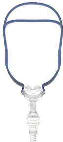
AirFit™ P10 para AirMini